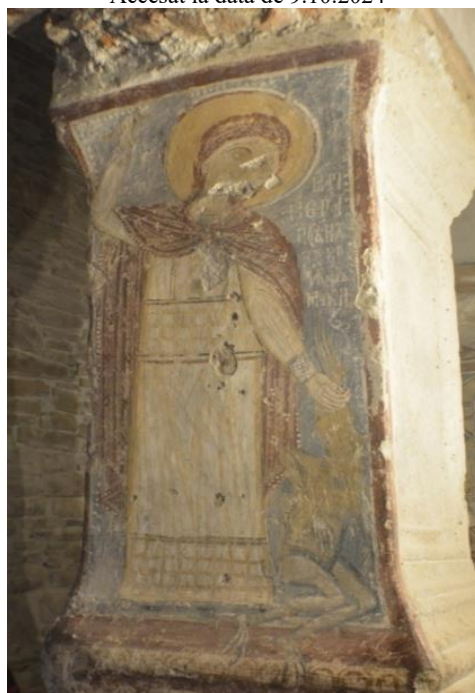
Fig. 4 Sfânta Marina . Biserica „Sfântul Nicolae” din Densuș, județul Hunedoara.