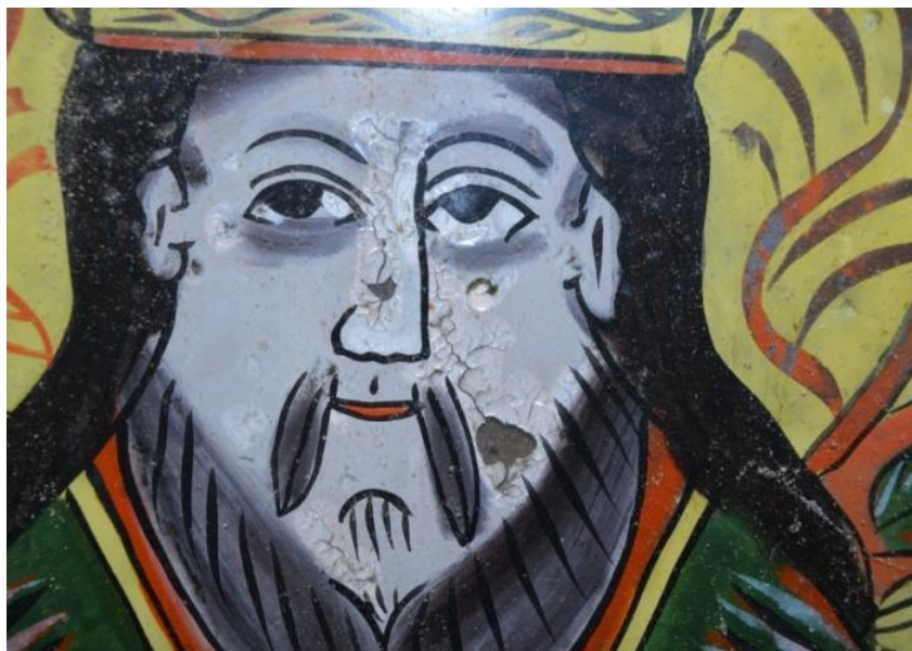
Fig. 6 Detaliu chip Sfântul Nicolae.