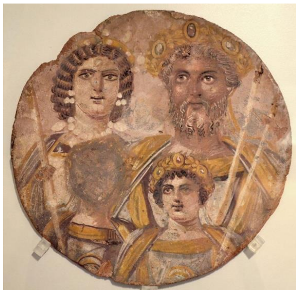
Fig. 2 Severan Tondo