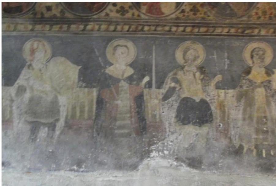
Fig. 5 Detaliu registru Sfinți Mucenici .

Biserica greco-catolică „Intrarea în Biserică a Maicii Domnului” din Teiuș, județul Alba.