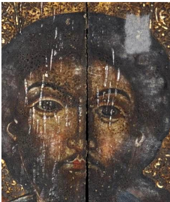
Fig. 10 Detaliu chip Iisus Hristos înainte de restaurare