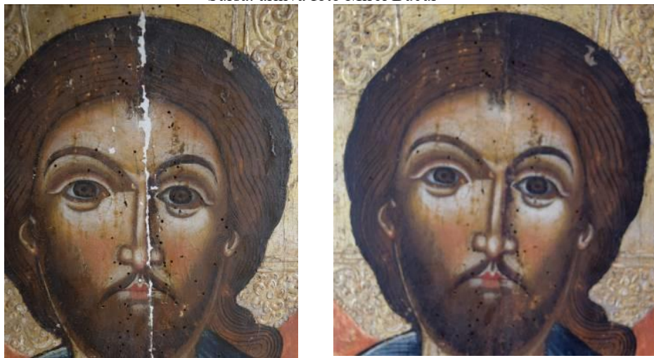
Fig. 11 Detaliu chip Iisus Hristos în timpul chituirii și după restaurare