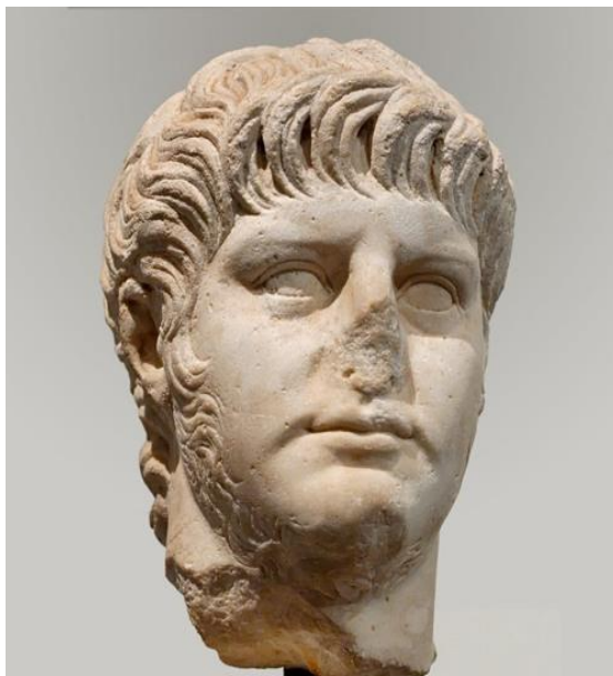
Fig. 1 Portretul împăratului Nero

Sursa: https://i1.sndcdn.com/avatars-000495073926-t54f7d-t500x500.jpg , Accesat la data de 9.10.2024