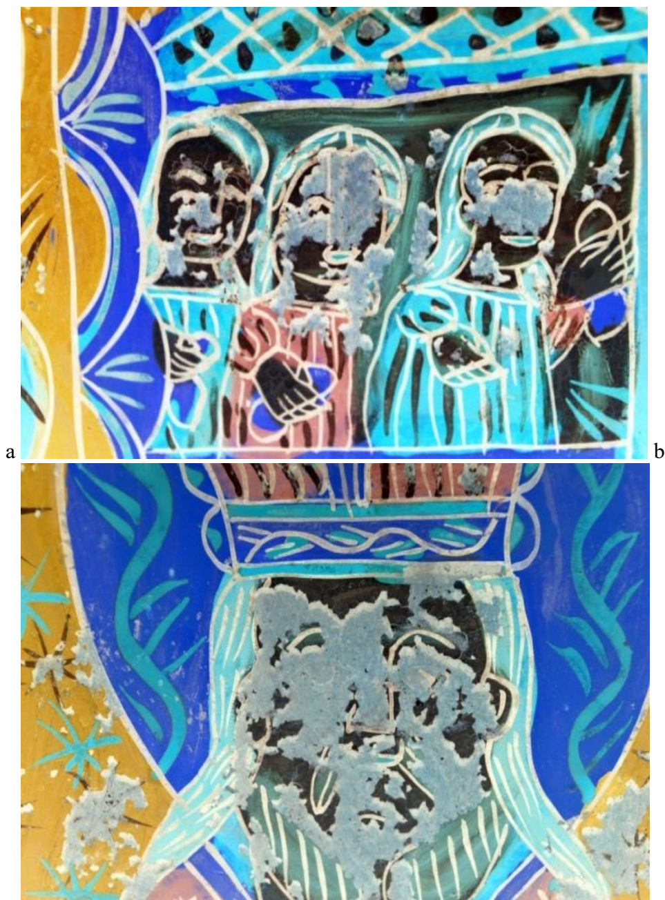
Fig. 8. a,b Fotografii editate în modul negativ. Detalii chipuri înainte de restaurare.