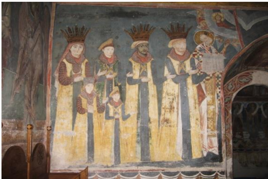
Fig. 3 Tabloul votiv de la Mănăstirea Probota al lui Petru Rareș și al familiei sale