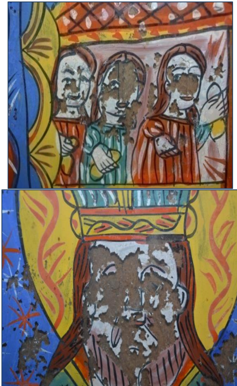
Fig. 7 Detalii chipuri fete și Sfântul Nicolae.