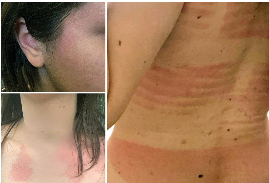
Slika 1. Urtike na koži lica, leđa i dekoltea, sa jasno izraženom distribucijom u zonama izloženim sunčevoj scetlosti

Figure 1. Urticarial lesions involving the skin of the face, back and upper chest, with a clear predilection for photo exposed regions